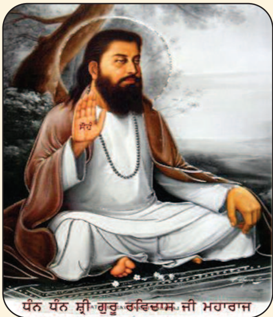
ਧੰਨ ਧੰਨ ਸ੍ਰੀ-ਗੁਰੂ-ਰਵਿਦਾਸ-ਜੀ ਮਹਾਰਾਜ

ਬਹੁਤ ਜਨਮ ਬਿਛੁਰੇ ਥੇ ਮਾਧਉ ਇਹੁ ਜਨਮ ਤੁਮਾਰੇ ਲੇਖੇ ॥ ਕਹਿ ਰਵਿਦਾਸ ਆਸ ਲਗਿ ਜੀਵਉ ਚਿਰ ਭਇਓ ਦਰਸਨ ਦੇਖੇ ॥