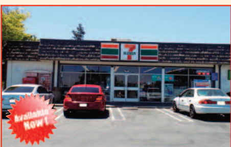
7Eleven 7 Eleven Store For Sale in Antioch, CA Listing Price: $550,000