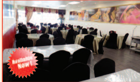
Indian Restaurant for Sale in Sacramento Listing Price: $149,000