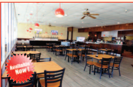
Indian Restaurant For Sale In Stockton All Equipment & Fixtures Included Listing Price: $149,900

ਕੀ ਤੁਸੀਂ ਸੈਕਰਾਮੈਂਟੋ / ਬੇ-ਏਰੀਆ ਵਿਚ ਘਰ ਜਾਂ ਵਪਾਰਕ ਸੰਪਤੀ ਖਰੀਦਣ ਜਾਂ ਵੇਚਣ ਦੇ ਚਾਹਵਾਨ ਹੋ ਤਾਂ ਅੱਜ ਹੀ ਕਾਲ ਕਰੋ 916-271-5404