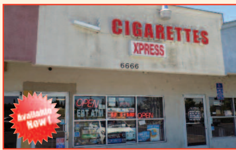
Smoke Shop for Sale in Sacramento Monthly Gross Sales: $50K Listing Price: $89,000