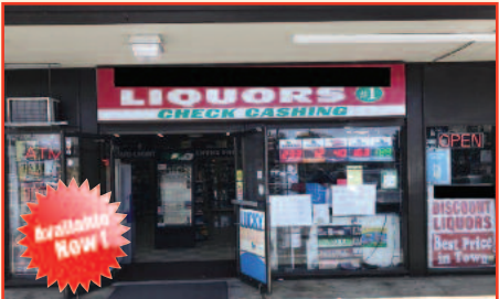
Liquor Store for Sale in Santa Clara Monthly Gross Sale: $90K Listing Price: $649,000 plus Inventory