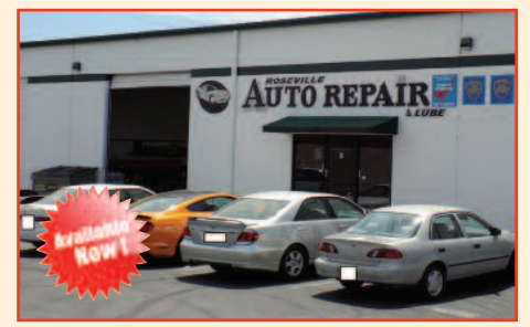
Auto Repair & Lube Shop Lot Size: 2000, Rent is ONLY $1500/mo. Listing Price to $149,000 Sacramento, CA