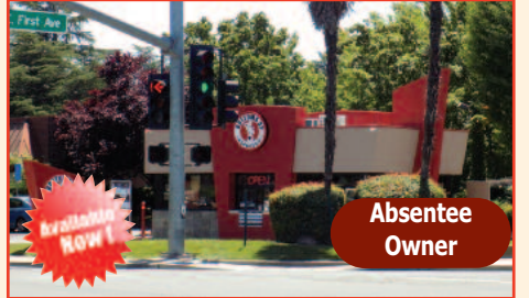
Coffee Shop for Sale Monthly Gross Sales: $25,000 Listing Price: $150,000