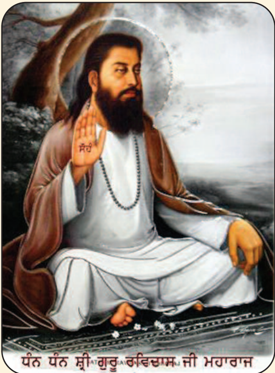
ਧੰਨ ਧੰਨ ਸ੍ਰੀ ਗੁਰੂ ਰਵਿਦਾਸ ਜੀ ਮਹਾਰਾਜ

ਬਹੁਤ ਜਨਮ ਬਿਛੁਰੇ ਥੇ ਮਾਧਉ ਇਹੁ ਜਨਮ ਤੁਮਾਰੇ ਲੇਖੇ ॥ ਕਹਿ ਰਵਿਦਾਸ ਆਸ ਲਗਿ ਜੀਵਉ ਚਿਰ ਭਇਓ ਦਰਸਨ ਦੇਖੇ ॥