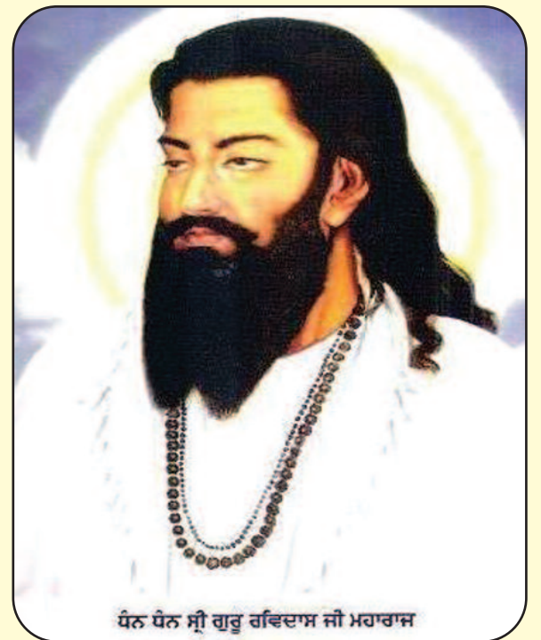
ਧੰਨ ਧੰਨ ਸ੍ਰੀ ਗੁਰੂ ਰਵਿਦਾਸ ਜੀ ਮਹਾਰਾਜ

ਸ੍ਰੀ ਗੁਰੂ ਰਵਿਦਾਸ ਜੀ ਦੇ 643ਵੇਂ ਖੂਕਾਸ਼ ਦਿਹਾੜੇ ਦੀਆਂ ਲੱਖ-ਲੱਖ ਵਧਾਈਆਂ ਸ੍ਰੀ ਗੁਰੂ ਰਵਿਦਾਸ ਸਭਾ ਫਰਿਜ਼ਨੋ (ਕੈਲੇਫੋਰਨੀਆ) ਸਤਿਗੁਰੂ ਰਵਿਦਾਸ ਜੀ ਦਾ ਗੁਰਪੁਰਬ ਦਿਹਾੜਾ 1 ਮਾਰਚ 2020, ਦਿਨ ਐਤਵਾਰ ਨੂੰ ਸਾਧ ਸੰਗਤ ਦੇ ਸਹਿਯੋਗ ਨਾਲ ਪੂਰਨ ਸ਼ਰਧਾ ਅਤੇ ਉਤਸ਼ਾਹ ਨਾਲ ਮਨਾਉਣ ਜਾ ਰਹੀ ਹੈ। ਸ੍ਰੀ ਅਖੰਡ ਪਾਠ ਸਾਹਿਬ ਜੀ 28 ਫਰਵਰੀ 2020 ਦਿਨ ਸ਼ੁੱਕਰਵਾਰ ਨੂੰ ਪ੍ਰਾਰੰਭ ਹੋਣਗੇ ਅਤੇ 29 ਮਾਰਚ ਦਿਨ ਸ਼ਨਿਚਰਵਾਰ ਨੂੰ ਸ਼ਾਮੀ 5 ਵਜੇ ਨਿਸ਼ਾਨ ਸਾਹਿਬ ਦੀ ਸੇਵਾ ਹੋਵੇਗੀ। 1 ਮਾਰਚ ਨੂੰ ਸਵੇਰੇ 10 ਵਜੇ ਅਖੰਡ ਪਾਠ ਸਾਹਿਬ ਦੇ ਭੋਗ ਪਾਏ ਜਾਣਗੇ, ਉਪਰੰਤ ਦੁਪਹਿਰ ਬਾਅਦ ਤੱਕ ਦੀਵਾਨ ਸਜਣਗੇ, ਜਿਸ ਵਿਚ ਰਾਗੀ ਜਥੇ ਸ਼ਬਦ ਗਾਇਨ ਕਰਨਗੇ ਅਤੇ ਬੁਲਾਰੇ ਗੁਰੂ ਜੀ ਪ੍ਰਤੀ ਆਪੋ-ਆਪਣੇ ਵਿਚਾਰ ਰੱਖਣਗੇ। ਸਮੂਹ ਸਾਧ ਸੰਗਤ ਦੇ ਚਰਨਾਂ ਵਿਚ ਬੇਨਤੀ ਹੈ ਕਿ ਤਿੰਨੇ ਦਿਨ ਗੁਰੂ ਘਰ ਹਾਜ਼ਰੀਆਂ ਲਗਵਾ ਕੇ ਸਤਿਗੁਰੂ ਅਤੇ ਗੁਰੂ ਘਰ ਦੀਆਂ ਖੁਸ਼ੀਆਂ ਪ੍ਰਾਪਤ ਕਰੋ ਜੀ।