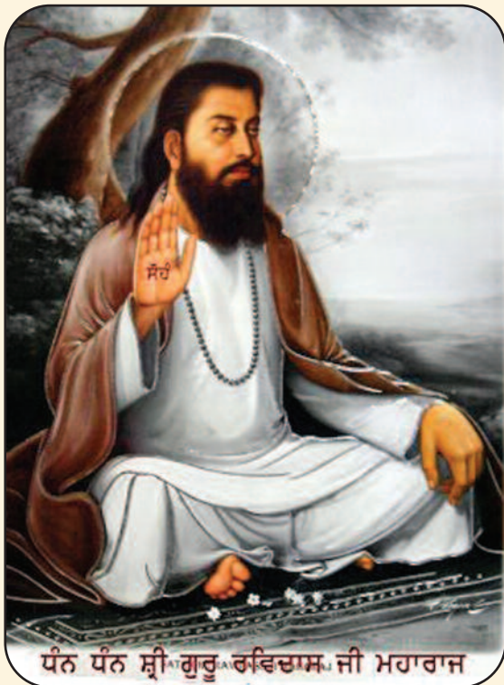
ਧੰਨ ਧੰਨ ਸ੍ਰੀ ਗੁਰੂ ਰਵਿਦਾਸ ਜੀ ਮਹਾਰਾਜ

ਬਹੁਤ ਜਨਮ ਬਿਛੁਰੇ ਥੇ ਮਾਧਉ ਇਹੁ ਜਨਮ ਤੁਮਾਰੇ ਲੇਖੇ ॥ ਕਹਿ ਰਵਿਦਾਸ ਆਸ ਲਗਿ ਜੀਵਉ ਚਿਰ ਭਇਓ ਦਰਸਨ ਦੇਖੇ ॥