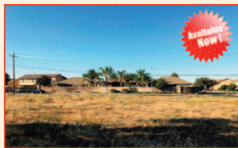
3 Bedroom 1 Bath Home on 10 Acre Lot Listing Price: $1,500,000