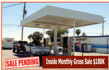
Gas Station, Liquor Store, Deli, & Laundromat! In Contra Costa County, CA Listing Price: $1,200,000