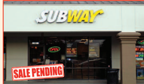
Subway for Sale in Sacramento Listing Price: $224,900